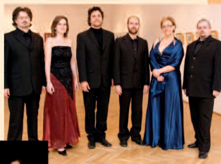
Corvina Consort ▲

○ Aranytíz Kultúrház Tolnay terem (Arany J. u. 10.)