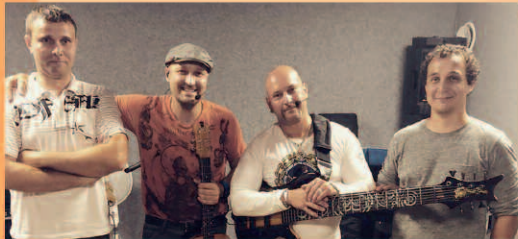
◀ Kifli Együttes

Aranytíz Kultúrház Tolnay terem (Arany J. u. 10.)