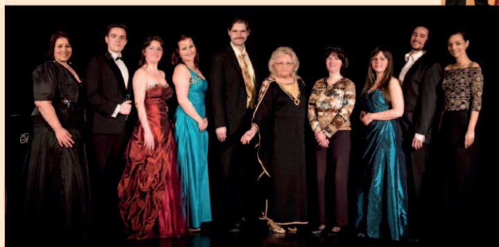
◀ Bel Canto Operatársulat