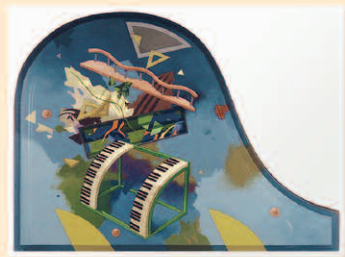
▲ Barabás Márton festménye