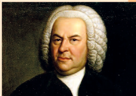
▲ Johann Sebastian Bach

○ Budapesti Ward Mária Iskola Tolnay Klári terem (Váci u. 47. - Irányi u. 3.)